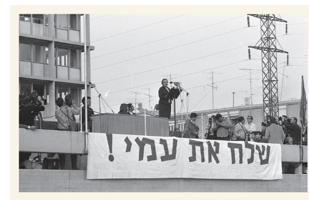
גולדה מאיר בהפגנה למען אסירי ציון

עוד לא אֶבְדָּה תְּקוּנָתָהּ, הַתְּקוּהָ בֵּת שְׁנוֹת אֲלֵפִים, לְהִיּוֹת עִם חֶפְשִׁי בְּאַרְצָנוּ, אֶרֶץ צִיּוֹן וִירוּשָׁלַיִם.